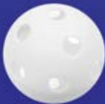
tréninkový míček pro baseball