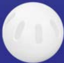
míček pro wiffle ball

Také míček je původem ze Spojených států amerických, vyvinul se z tréninkového míčku pro baseballové nadhazovače, jehož podoba se v průběhu let pro florbal změnila jen v lehkém zmenšení průměru. Původ děrovaného míčku sahá až do roku 1953, kdy na svět přišla modifikace baseballu zvaná Wiffle ball, jejímž středobodem je lehký plastový míček s asymetrickým podlouhlým děrováním, jež má nadhazovačům pomoci k zakřivení dráhy letu míčku.